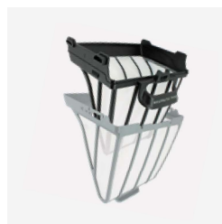
Glavni filter 150μ za dvostupanjsko ili samostalno korištenje Ultra-fini filter 60μ za dvostupanjsko korištenje